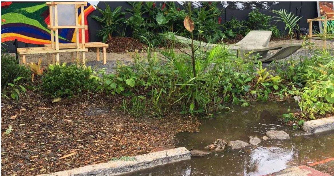
Figura 7: Jardim de chuva alagado, em frente à Casa Cor, no bairro do Morumbi.