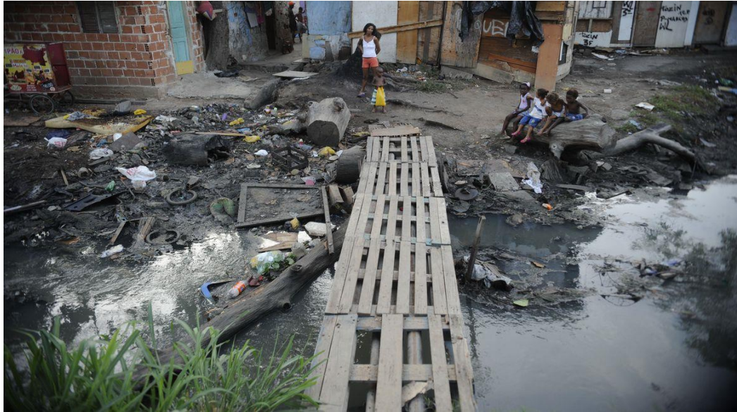
Figura 2: Esgoto a céu aberto no Complexo de Favelas da Maré na Zona Norte do Rio de Janeiro