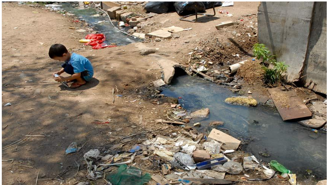
Figura 4:Foto utilizada na matéria: “A cobertura de saneamento básico no Brasil[...]”

( http://www.respostassustentaveis.com.br/blog/saneamento-basico/ )