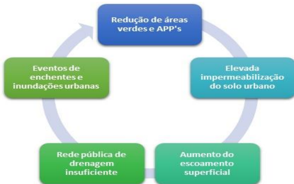
Figura 5: Fluxo de ocorrência das enchentes.

Muitas cidades brasileiras enfrentam problemas recorrentes de alagamentos e deslizamentos de terra, especialmente durante as estações chuvosas. A falta de infraestrutura adequada de drenagem, aliada ao desmatamento e ao crescimento desordenado, contribui para esses problemas. Outro grande fator que se pode observar é o crescimento de forma esponencial e o impacto causado pelas mudanças climáticas que têm aumentado a frequência e a intensidade das chuvas em muitas regiões do Brasil, tornando os desafios relacionados à drenagem urbana ainda maiores. Eventos climáticos extremos, como chuvas torrenciais e tempestades, podem levar a inundações mais graves.